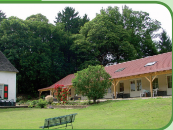
Vakantieboerderij en Wijngaard De Holdeurn

Wijngaard De Plack, Ketelstraat 36 Groesbeek, T. 024-3978358, wijngaarddeplack.nl , nabij 78