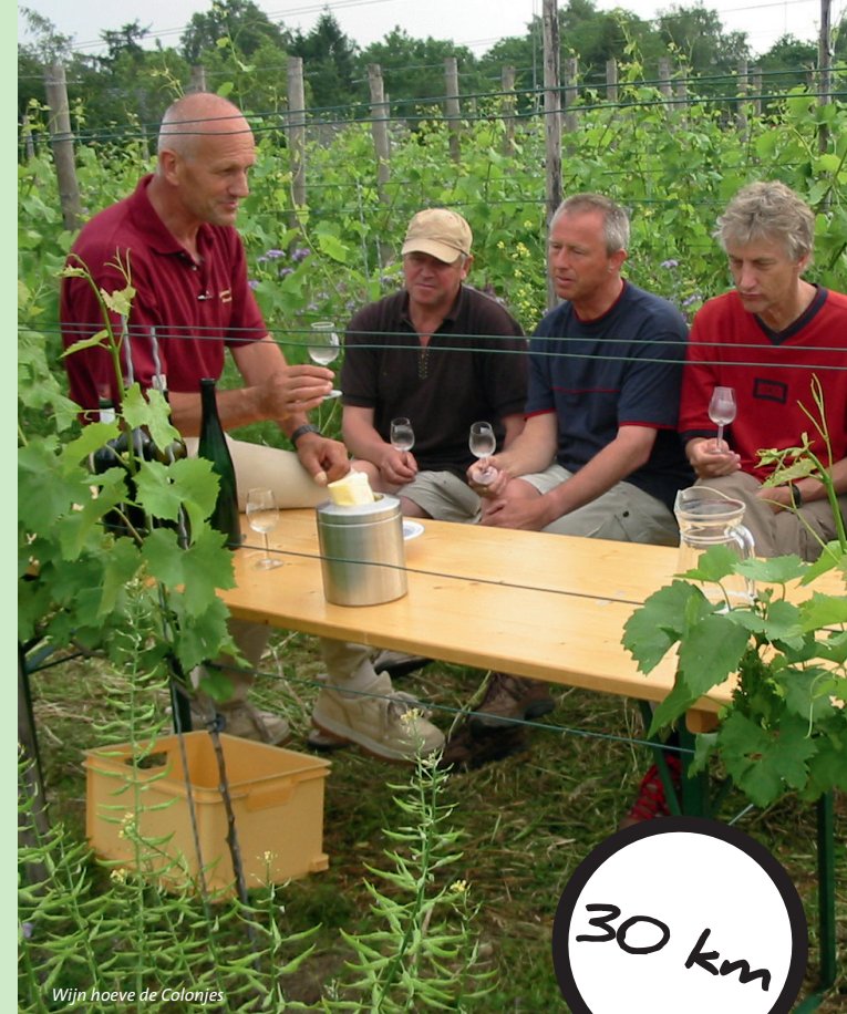
Wijn hoeve de Colonjes

Copyright: Regionaal Bureau voor Toerisme Arnhem Nijmegen, 2013. Niets uit deze folder mag worden overgenomen, op welke wijze dan ook, zonder voorafgaande schriftelijke toestemming van de copyrighthouder / uitgever.