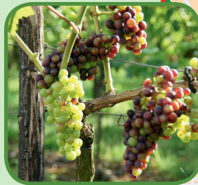
Wijnhoeve de Heikant