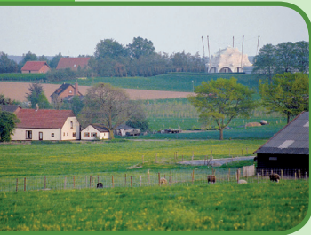
Het Groesbeekse landschap

Wijnhoeve De Heikant is gelegen aan het draisine-traject Groesbeek-Kranenburg-Kleef. In 2010 werd hier het Wijnchateau geopend, waar men onder meer kan proeven van wijn van De Heikant en kan uitkijken over de wijngaard. In de wijnkelder worden de wijnen geproduceerd.