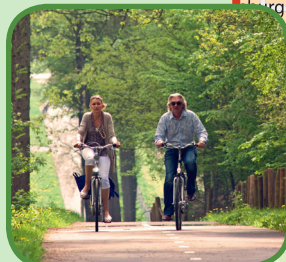
Fietsers op de Zevenheuvelenweg